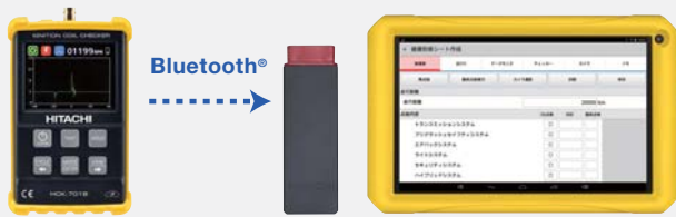
日立ダイアグモニタ HDM-8000

HCK-701B で測定したデータをダイアグモニタ HDM-8000 に無線送信。健康診断シートに自動的に反映します。