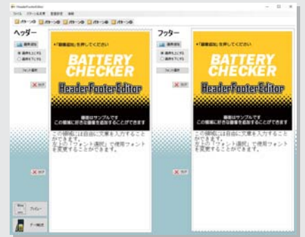
ヘッダー / フッター追加アプリケーション

「ヘッダー / フッター追加アプリケーション」を当社ホームページの「HCK-602FB ユーザー専用ページ」からパソコンにダウンロード。パソコン操作で文字や画像を登録することで、店舗名や販促クーポンなどテストレポートのヘッダー（上部）とフッター（下部）に追加することが可能です。ユーザー専用ページから無料素材をダウンロードして使用できるほか、お手持ちの画像データも使用可能です。バッテリーの販売促進や顧客来店ツールとしてご活用いただけます。