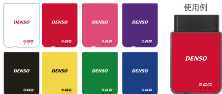
フロントパネルラベルシート(8色)